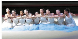
Les gymnastes de la GR Breizh'Illyenne de Thorigné-Fouillard au championnat de France de gymnastique.

La gym rythmique au gala du championnat de France